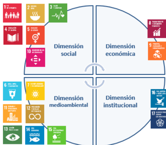
Ilustración 3. Dimensións diferenciadas dentro do conxunto dos ODS.