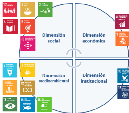
Ilustración 3. Dimensións diferenciadas dentro do conxunto dos ODS.